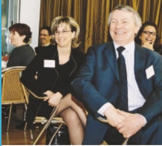
Les journées d'accueil : l'occasion d'un rapprochement entre HEC Montréal et le marché du travail.

Cette année, le Bureau de développement a mis sur pied des journées d'accueil visant le rapprochement entre un milieu ou une industrie donnée et HEC Montréal. Trois de ces rencontres ont eu lieu, chacune couronnée de succès. En octobre 2002, nous recevions des représentants de Rx&D, une association vouée au développement et à la recherche pharmaceutiques. En mars 2003, nous avons accueilli le Conseil québécois du commerce de détail. Le 19 juin, c'était au tour du cabinet comptable KPMG de franchir nos portes. Nos invités ont grandement apprécié ces prises de contact. Des liens se sont resserrés entre les représentants du milieu de la formation et ceux du marché du travail, de la pratique. De telles journées sont enrichissantes pour tous, et nous avons l'intention de répéter l'expérience en 2003-2004.