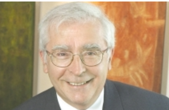
Monsieur Jean-Marie Toulouse Directeur, HEC Montréal

HEC Montréal, ce sont 40 000 diplômés disséminés partout dans le monde, dont certains occupent les plus hauts échelons de grandes multinationales.