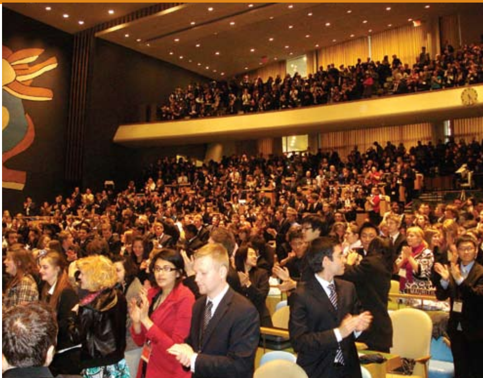
Cérémonie de clôture de la simulation ONU