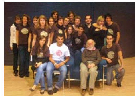
Hubert Reeves, entouré du groupe HumaniTerre

Plus de 300 personnes ont assisté à la conférence d'Hubert Reeves, le 16 octobre 2008, organisée par le groupe HumaniTerre pour sensibiliser les étudiants aux enjeux du développement durable.