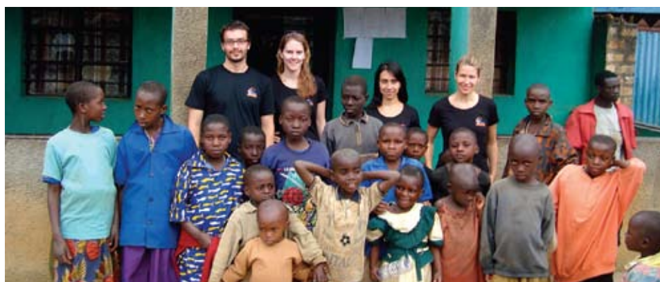
L'équipe MBA du Rwanda en face des locaux de l'organisme Kageno, en compagnie de quelques enfants de la communauté