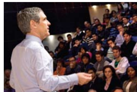
M. Ignatieff devant un parterre d'étudiants du MBA et de professeurs à l'amphithéâtre IBM

Le 21 janvier 2009, l'Association des étudiants du MBA a accueilli Michael Ignatieff, chef du Parti libéral du Canada, qui s'est adressé aux quelque 475 étudiants pour livrer les grandes lignes de la position de son parti quant à la situation économique du pays. Le chef de l'opposition officielle a également échangé avec eux sur leurs principales préoccupations et interrogations en matière d'économie et de finance de l'État.